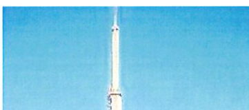
Une nuit sous les étoiles au Pic du Midi