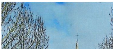
Marciac, un... Grand Site du jazz