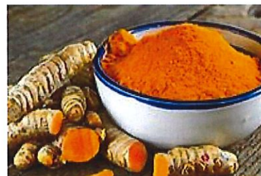
Ne prenez plus un gramme de curcuma avant d'avoir lu cet article! (Cell'innov)