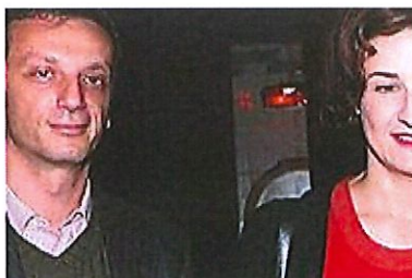
VIDEO- Valérie Lemerrier a 53 ans : qui sont les 4 hommes se sa vie ? (Gala)