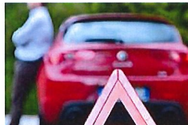
Le classement des assureurs auto en France (LeCompareurAssurance.com)