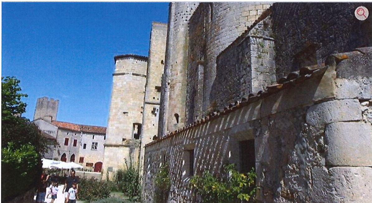
Le village fortifié de Larressingle va bénéficier du label «Grand site Occitanie».

C'est Noël avant l'heure pour les acteurs gersois du tourisme. La Région Occitanie a octroyé le label «Grand site» à Auch, à Marciac et à l'Armagnac, autour de Flaran et Condom.