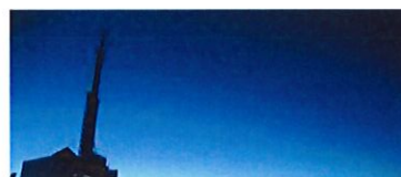
La nuit, la magie opère et le jour, descente en VTT pour les sportifs