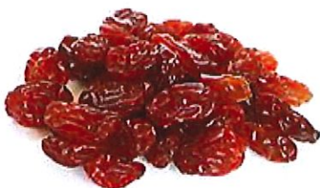
Comment perdre un peu de poids chaque jour (connaissez-vous cette astuce?) (Nutrition Optimale)