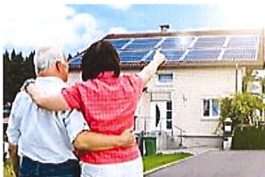
Propriétaires de maison l'État vous aide, passez au solaire! (EconomiserSonEnergie.com)